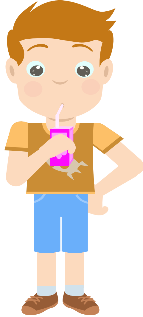
ولد يشرب عصير