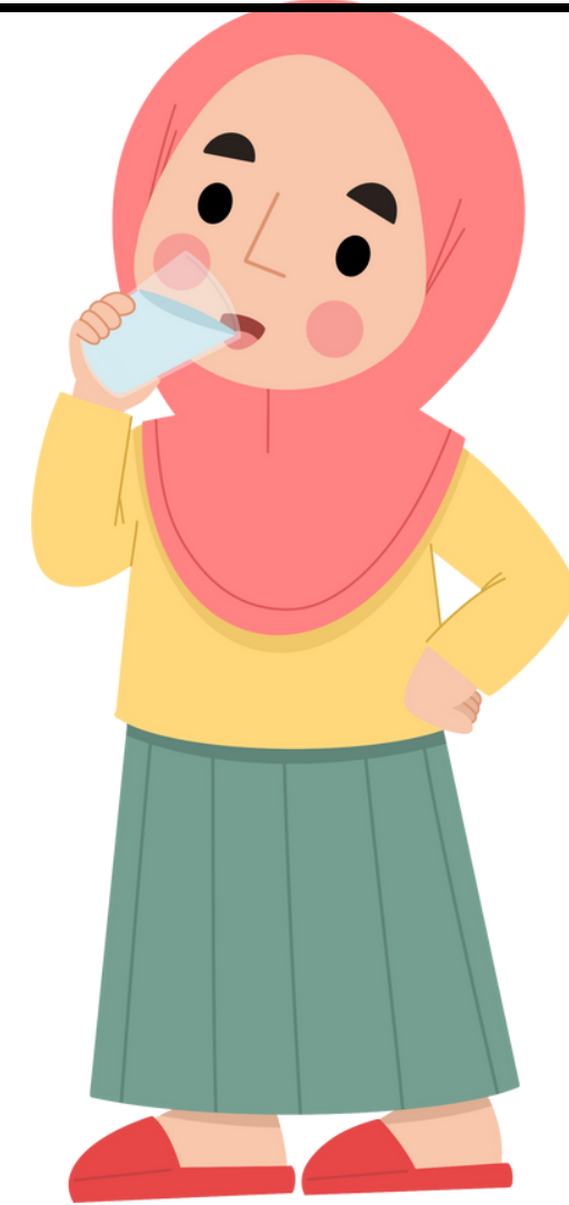
بنت تشرب ماء